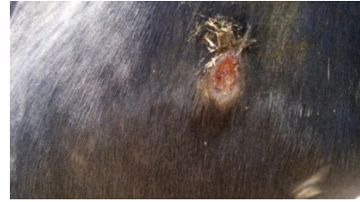
تصویر ۲: ندول جلدی که تبدیل به زخم شده همراه با ترشحات چرکی به رنگ عسلی

آن منفی شد. با توجه به امکان منفی شدن آزمایش مالئین در مراحل پیشرفته و تب‌دار بیماری ( OIE Terrestrial Manual 2015) و نیز وجود تورم زنجیره‌وار ندولی در امتداد طناب لنفاتیکی گردن، به جهت شک به استرانگل ۱ و لنفانژیت السراتیو ۲ ، سواب عمیق از مخاط بینی دو طرف و یک ندول باز نشده زیرجلدی با رعایت شرایط استریل و شکافته شدن با اسکالپل (تصویر ۶)، تهیه و پس از انتقال به محیط انتقالی مایع Glycerol broth حاوی ۳ درصد گلیسرول، پس از انجماد و نگهداری به مدت سه هفته در شرایط سرد، به آزمایشگاه میکروبیولوژی مؤسسه‌ی تحقیقات واکسن و سرم‌سازی رازی کرج ارسال شد. لازم به ذکر است، نمونه‌ی سرم جهت انجام آزمایش‌های سرولوژی تست ثبوت مکمل ۳ و الایزا در تشخیص بیماری مسمشه، که قبل از آزمایش جلدی مالئین از دام بیمار اخذ شده بود، نیز به آدرس فوق ارسال شد. سواب‌ها پس از انتقال به محیط Glycerol broth حاوی ۳ درصد گلیسرول، به مدت ۲۴ ساعت در انکوباتور ۳۷ درجه‌ی سانتی‌گراد، در محیط اختصاصی آگار خوندار حاوی گلیسرول کشت شدند. از کشت سواب اخذ شده از ندول جلدی، هیچ میکروبی جدا نشد اما از کشت سواب‌های مخاط بینی پس از انجام آزمایش‌های تکمیلی (رنگ‌آمیزی گرم: کوکسی گرم مثبت، کاتالاز: منفی، همولیز: بتا، سوربیتول: منفی، لاکتوز: منفی و ترهالوز: منفی) روی پرگنه‌های خالص‌سازی شده، باکتری استرپتوکوکوس اکوئی جدا گردید. در کشت هیچ یک از سه سواب ارسالی، باکتری بورخولدريا مالئی جدا نشد. از طرفی، آزمایش ثبوت مکمل با استفاده از بافر سالین ورونال ۴ حاوی ژلاتین ۱ درصد، کمپلمان خوکی‌چهی هندی و سوسپانسیون ۳-۲ درصد گلبول قرمز گوسفندی و نیز آزمایش الایزا غیرمستقیم جهت تشخیص تفریقی مسمشه