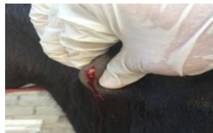
تصویر ۶: شکاف یک ندول زیرجلدی با رعایت شرایط

طبق پرتوکل (OIE Terrestrial Manual (2015)، انجام و نتایج هر دو آزمایش مثبت شدند. آزمایش هماتولوژی بیمار بیانگر لکوسیتوز، نوتروفیلی ۸۰ درصد، هموگلوبین ۸/۵ گرم در دسی لیتر و هماتوکریت ۲۶/۵ درصد بود. همچنین مقادیر سرمی کلسیم، فسفر، سدیم و پتاسیم بیمار به ترتیب ۱۰/۴ میلی گرم در دسی لیتر، ۱/۹ میلی گرم در دسی لیتر، ۱۲۹/۹ میلی مول در لیتر و ۳/۶ میلی مول در لیتر بود.