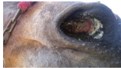
تصویر ۴: جراحی مخاط بینی به قطر ۳-۲ سانتی‌متر همراه با تجمعی از غشاهای کاذب چرکی در دام بیمار