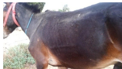
تصویر ۵: برجستگی خطی شکل Heaves Line در محل اتصال دنده‌ای - غضروفی، دو طرف قفسه سینه در دام بیمار