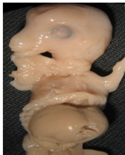
تصویر ۸: تصویر جنین گوسفند نر با سن ۴۳ روز در زیر لوپ، نمای شکمی جانبی محوطه‌ی شکمی باز شده ولی گره‌ی لنفی قابل مشاهده وجود نداشت

در خصوص سن مشاهده‌ی ماکروسکوپی گره‌های لنفی در جنین گوسفند، تمام گره‌های مورد بررسی در بیش‌تر جنین‌ها دیده شدند اما موارد استثنایی نیز وجود داشت. برای مثال، در دو جنین ۴۳ روزه و ۴۴ روزه از گروه اول که کم‌ترین سن را در میان جنین‌ها داشتند، هیچ گره‌ی لنفی به صورت ماکروسکوپی دیده نشد (تصویر ۸). همچنین گره‌ی لنفی روده‌بندی تهی روده‌ای در این بررسی ابتدا در جنین ۵۹ روزه به صورت ماکروسکوپی دیده شد. در گروه اول از نظر ماکروسکوپی، ۸ قطعه جنین (۵۳/۳۳) فاقد گره روده‌بندی تهی روده‌ای بودند که در میان آن‌ها جنین ۴۳ روزه کم‌ترین سن و ۵۷ روزه بیش‌ترین سن عدم مشاهده‌ی گره‌ی لنفی روده‌بندی را داشتند.