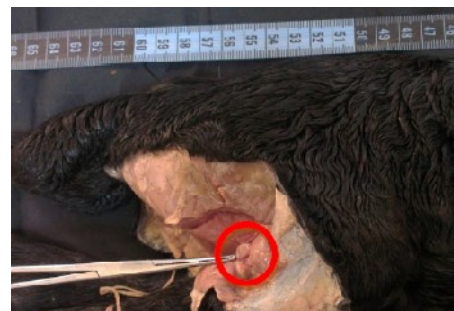
تصویر ۴: جنین گوسفند نر با سن ۱۳۸ روز، نمای عقبی جانبی طرف راست نوک پنس موقعیت قرارگیری گرهی لنفی رکیبی راست را نشان می‌دهد.

از نظر مورفولوژی گره‌های لنفی در جنین‌های گوسفند مورد بررسی، شکل‌های متفاوت (تصویر ۷) در گروه‌های مختلف دیده شد که به تفکیک در جدول ۲ بیان شده است.