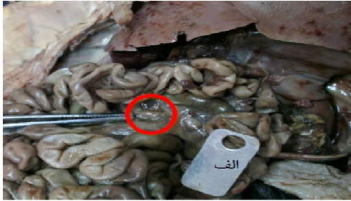
تصویر ۵: موقعیت قرارگیری گرهی روده‌بندی تهی روده‌ای در جنین گوسفند نر با سن ۱۱۱ روز، نمای جانبی راست الف: شاخص به طول ۲ سانتی‌متر، نوک پنس یک گرهی لنفی روده‌بندی تهی روده‌ای بیضی شکل را نشان می‌دهد.