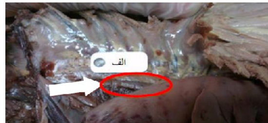
تصویر ۳: جنین گوسفند نر با سن ۱۱۱ روز، نمای جانبی سمت چپ پس از برداشتن دیواره‌ی قفسه‌ی سینه نوک پیکان موقعیت قرارگیری گرهی لنفی میان سینه‌ای پسین را نشان می‌دهد (الف: شاخص ۲ سانتی‌متری)

از نظر مورفولوژی گره‌های لنفی در جنین‌های گوسفند مورد بررسی، شکل‌های متفاوت (تصویر ۷) در گروه‌های مختلف دیده شد که به تفکیک در جدول ۲ بیان شده است.