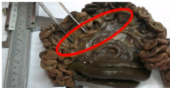
تصویر ۶: موقعیت قرارگیری گرهی روده‌بندی تهی روده‌ای در جنین گوسفند نر با سن ۱۱۱ روز، نمای خارج از بدن نوک پنس گره‌های لنفی روده‌بندی تهی روده‌ای نواری شکل را نشان می‌دهد.