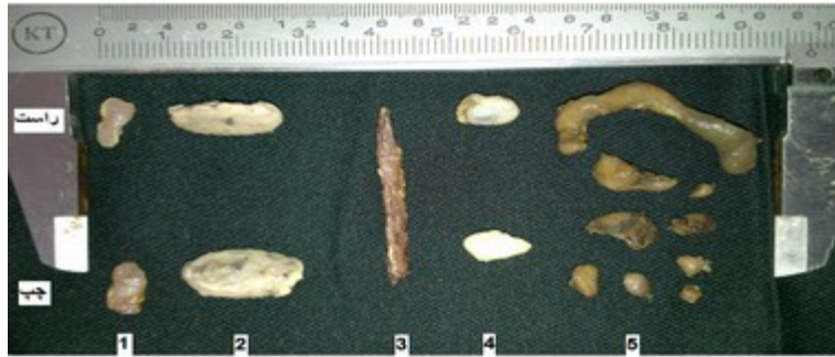
تصویر ۷: شکل‌های مختلف گره‌های لنفی جنین گوسفند نر با سن ۱۳۸ روز

۱: گره‌ی فک پایینی، ۲: گره‌های پیش کتفی، ۳: گره‌ی میان سینه‌ای پسین، ۴: گره‌های رکبی، ۵: گره‌های روده‌بندی