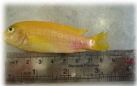
تصویر ۱: Labidochromis caeruleus

برای انجام این تحقیق تعداد ۱۲۰ قطعه ماهی ماکرو (بدون در نظر گرفتن جنسیت) با میانگین وزن اولیه‌ی 6/5 \pm 0/65 گرم و با میانگین سن ۲ ماه از یکی از مراکز پرورش ماهیان زیتنی اهواز خریداری شد. برای این کار ۱۲۰ قطعه ماهی به طور اتفاقی به چهار گروه تقسیم شده (هر آکوارיום حاوی ۳۰ قطعه ماهی) و به مدت ۶۰ روز برای انجام آزمایش، نگهداری و غذادهی شدند (تصویر ۱). جیره‌ی غذایی روزانه بر اساس ۲ درصد وزن بدن ماهی‌ها در نظر گرفته شد و سه بار در روز غذادهی انجام می‌شد. تیمار اول، دوم و سوم به ترتیب با مقادیر ۵، ۱۰ و ۱۵ گرم عصاره‌ی اتانولی جلبک سارگاسوم به ازاء هر کیلوگرم غذا به مدت دو ماه تغذیه شدند. تیمار چهارم، گروه شاهد بود که فقط غذای تجاری (بیومار) که با روغن زیتون پوشش داده شد، دریافت می‌نمود. غذای حاوی عصاره‌ی جلبک نیز مشابه گروه شاهد با روغن زیتون پوشش داده شد (Costa et al. 2013).