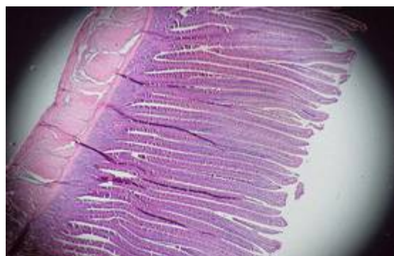
تصویر ۲: افزایش طول پرز در اثر تغذیه‌ی سطح ۱۰۰ میلی‌گرم در کیلوگرم عصاره‌ی میوه پنیر باد در سن ۴۲ روزگی