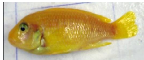
تغذیه شده با لارنسیا (۱۰g/kg)