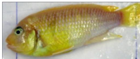
تغذیه شده با سارگاسوم (۱۰g/kg)