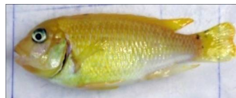
تغذیه شده با لارنسیا (۵g/kg)