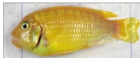
تغذیه شده با لارنسیا (۱۵g/kg)

تصویر ۱: نتایج حاصل از تغییر رنگ ایجاد شده به روش تصویربرداری، به رنگ زرد ایجاد شده در ماهی‌های گروه‌های مختلف تغذیه شده با عصاره‌ی الکلی جلبک‌ها توجه شود