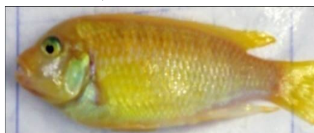
تغذیه شده با سارگاسوم (۱۵g/kg)