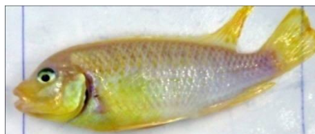
تغذیه شده با سارگاسوم (۵g/kg)