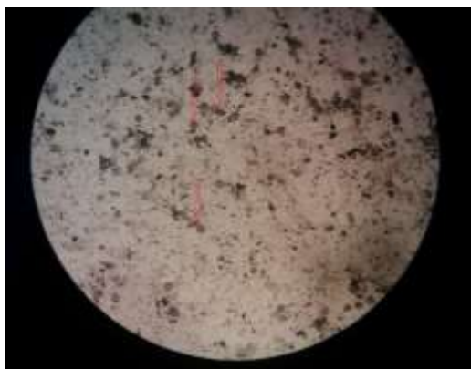
Fig 3: Microscopic image from Toxocara eggs observed in sample of Fadak park (the most polluted park)

درصد)، بلوار طاق بستان و پارک‌های معلم و زیبا پارک (۶۶/۶ درصد)، پارک لاله (۴۰ درصد) و پارک‌های شاهد، کودک و باران (۳۳/۳ درصد) قرار گرفتند. در بین پارک‌های مورد مطالعه، پارک شهید لرستانی هیچ‌گونه آلودگی نشان نداد. همچنین در مورد میزان آلودگی چمن، بیشترین میزان آلودگی در پارک‌های فدک و نشاط (۱۰۰ درصد) مشاهده شد، پس آن به ترتیب پارک‌های لاله (۸۰ درصد)، پارک معلم و بلوار طاق بستان غربی (۶۶/۶ درصد)، کوهستان (۶۰ درصد)، شاهد (۵۰ درصد)، کودک، شهید لرستانی، باران و زیبا پارک (۳۳/۳ درصد)، آزادگان (۲۰ درصد) و طاق بستان (۱۶/۶ درصد) قرار گرفتند. همچنین در پارک‌های طاق بستان شرقی، شیرین و پونه آلودگی مشاهده نشد. درصد آلودگی در پارک‌های واقع در شمال شهر بیشتر از پارک‌های واقع در مرکز و جنوب شهر بود. بیشترین شدت آلودگی در پارک فدک مشاهده شد که در نمونه‌های چمن و خاک به ترتیب تا ۴۰۰ و ۵ تخم انگل در هر میدان میکروسکوپی مشاهده شد. پس از آن بیشترین شدت آلودگی به ترتیب در پارک‌های معلم با ۱۲-۱ و ۵-۱ تخم انگل، نشاط با ۳-۱ و ۱۰-۲ تخم انگل، بلوار طاق بستان با ۱-۷ و ۳-۱ تخم انگل، طاق بستان با ۷-۱ و ۳-۱ تخم انگل، آزادگان با ۵-۱ و ۳-۱ تخم انگل، کوهستان با ۵-۱ و ۲-۱ تخم انگل و پارک شرقی با ۱-۴.۰ تخم انگل در هر میدان میکروسکوپی به ترتیب در نمونه‌های خاک و چمن بود. کمترین شدت آلودگی در پارک‌های شهید لرستانی، باران و شاهد مشاهده شد که تعداد تخم انگل مشاهده شده در نمونه‌های خاک و چمن در نمونه‌های مثبت از نظر آلودگی انگلی ۱ تخم انگل بود. شدت آلودگی در پارک‌های شیرین، لاله، پونه، کودک و زیبا پارک با مشاهده ۳-۱ تخم انگل در نمونه‌های مثبت از نظر آلودگی انگلی متوسط بود.