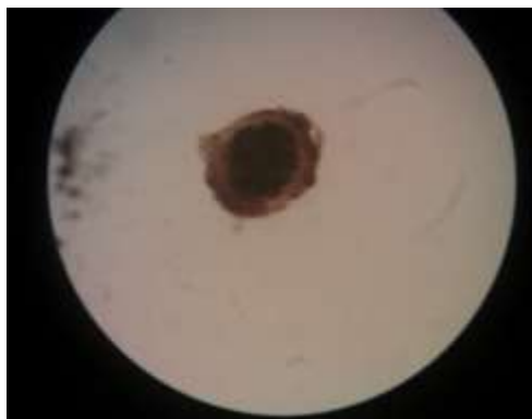
Fig 2: Toxocara egg separated from soil