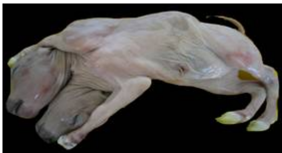
تصویر ۱: تصویر جنین گاو ماده‌ی دی‌سفالوس از نمای شکمی جانبی

در مراجعه به کشتارگاه دام اهواز جهت جمع‌آوری نمونه‌های جنینی، یک مورد جنین گاو ماده‌ی دی‌سفالوس دو رگه هلشتاین مشاهده شد. لذا برای بررسی بیشتر به بخش آناتومی و جنین‌شناسی دانشکده‌ی دامپزشکی دانشگاه شهید چمران اهواز منتقل گردید (تصویر ۱). طول فرق سر تا ریشه‌ی دم ۳ (CRL) به وسیله‌ی متر نواری اندازه‌گیری شد و به ترتیب برای سر سمت چپ ۳۹ و برای سر سمت راست ۳۷ سانتی‌متر ثبت گردید. سپس از جهت وجود دیگر ناهنجاری‌های ظاهری مورد ارزیابی ماکروسکوپی قرار گرفت و به منظور بررسی دقیق‌تر هم از نمونه دو رادیوگراف در نماهای پشتی شکمی و جانبی تهیه شد. پس از تهیه‌ی رادیوگراف‌ها، حفرات سینه و شکم تشریح گردید و نکات قابل توجه یادداشت شده و تصاویر لازم گرفته شد.