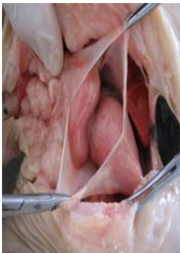
تصویر ۳: قفسه‌ی سینه باز شده جنین گاو دو سر از نمای شکمی جانبی. دو قلب با اندازه‌ی ناهم‌اندازه در یک آبشامه‌ی مشترک دیده می‌شود.