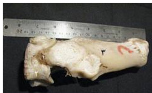
تصویر ۱۷: نمای سطح جانبی بخشی از مفصل میچ پای راست گاو میش. ۱- رباط میچ پائی- قلم پائی، ۲- استخوان مرکزی- چهارگوش، ۳- استخوان پاشنه