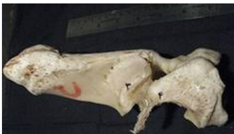
تصویر ۱۴: نمای سطح میانی بخشی از مفصل مچ پای چپ گاو میش . ۱- رباط‌های مچ پائی- قلم پائی، ۲- استخوان مرکزی- چهارگوش، ۳- مسند قاپ استخوان پاشنه، ۴- زائده کف پای داخلی استخوان مرکزی- چهارگوش