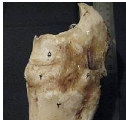
تصویر ۱۶: نمای سطح جانبی بخشی از مفصل میچ پای چپ گاو میش. ۱- رباط میچ پائی- بین استخوانی، ۲- زائده‌ی کف پایی داخلی استخوان مرکزی- چهارگوش، ۳- استخوان قلم، ۴- استخوان دومی و سومی، ۵- استخوان مرکزی- چهارگوش، ۶- استخوان اول میچ