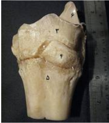
تصویر ۱۲: نمای سطح میانی بخشی از مفصل مچ پای چپ گاو میش . ۱- رباط‌های مچ پائی- قلم پائی ۲- بین مچ پائی- بین استخوانی، ۳- استخوان مرکزی- چهارگوش، ۴- استخوان دومی و سومی، ۵- استخوان قلم، ۶- زائده کف پای داخلی استخوان مرکزی - چهارگوش