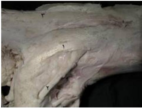
تصویر ۱: نمای سطح جانبی مفصل خم شده، مچ پای چپ گاومیش. ۱- رباط کولترال خارجی بلند، ۲- وتر نازک نی ای بلند، ۳- بخش کولترال رباط کف پائی بلند