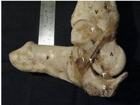
تصویر ۷: نمای سطح میانی بخشی از مفصل خم شده میچ پای چپ گاومیش. ۱- رباط درشت‌نی‌ای - پاشنه‌ای، ۲- شاخه‌ی درشت‌نی‌ای- قاپی، ۳- رباط میچ پائی - قلم پائی، ۴- شاخه‌ی درشت‌نی‌ای - قاپی، ۵- بخش انتهایی بالایی استخوان قلم پا، ۶- استخوان پاشنه، ۷- استخوان درشت نی، ۸- استخوان قاپ