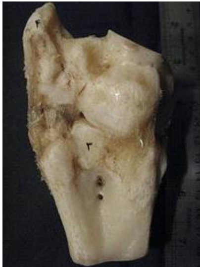
تصویر ۱۸: نمای سطح کف پائی بخشی از مفصل میچ پای چپ گاو میش. ۱- رباط میچ پائی- قلم پائی، ۲- استخوان مرکزی- چهارگوش، ۳- استخوان قلم، ۴- زائده‌ی کف پایی داخلی استخوان مرکزی- چهارگوش