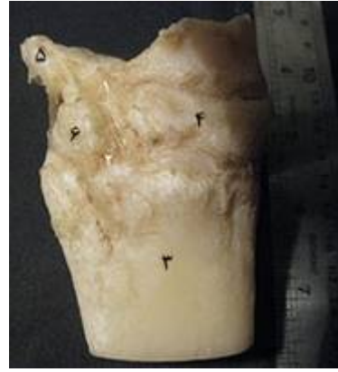
تصویر ۹: نمای سطح میانی بخشی از مفصل مچ پای راست گاو میش . ۱- رباط‌های بین مچ پائی- بین استخوانی، ۲- مچ پائی- قلم پائی، ۳- انتهای بالایی استخوان قلم پا، ۴- استخوان دومی و سومی، ۵- زائده کف پای داخلی استخوان چهارگوش مرکزی، ۶- استخوان اول مچ