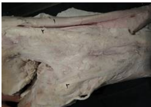
تصویر ۳: نمای سطح جانبی مفصل مچ پای چپ گاومیش. ۱- وترخم کننده سطحی بندهای انگشت، ۲- بخش کولترال رباط کف پای بلند، ۳- رباط کولترال خارجی بلند

پائی ناحیه‌ی مچ به هم وصل شده و یک غلاف وتري مشترك به وجود آورده که وترهای خم کننده‌ی سطحی و عمقی بندهای انگشت را احاطه کرده بود (تصاویر ۲، ۳ و ۴). (۳) بخش بینابینی (Intermediate limb): این رباط ضخیم از لبه‌ی کف پائی راس برجستگی پاشنه تا برابر مسند قاپ به استخوان پاشنه چسبیده بود و تا مسند قاپ از روی آن وتر خم کننده‌ی سطحی بندهای انگشت به سمت پایین طی مسیر کرده بود که خود وتر در یک غلاف مچ پائی (Tarsal sheath) ضخیمی که به واسطه‌ی رباط بینابینی تشکیل گردید، محصور شده بود، که از ابتدای راس برجستگی پاشنه تا مسند قاپ وتر خم کننده سطحی بندهای انگشت را در بر گرفته بود و از مسند قاپ به پائین وتر مزبور، وتر خم کننده عمقی بندهای انگشت را احاطه کرده بود (تصاویر ۱ و ۴).