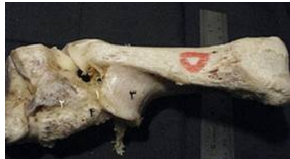
تصویر ۱۵: نمای سطح کف پائی بخشی از مفصل میچ پای چپ گاو میش. ۱- رباط‌های میچ پائی- قلم پائی، ۲- استخوان مرکزی- چهارگوش، ۳- مسند قاب استخوان پاشنه، ۴- زائده‌ی کف پایی داخلی استخوان مرکزی- چهارگوش

درباره‌ی رباط کولترال داخلی کوتاه، Gupta و Sharma در سال ۱۹۹۱ در گاو کوهان‌دار وجود دو بخش سطحی و عمقی را برای این رباط در نظر گرفتند، در حالی که در پژوهش حاضر رباط کولترال داخلی کوتاه دارای سه شاخه بود. از طرف دیگر، Nikel و همکاران در سال ۱۹۸۶ بیان داشتند که این رباط در گاو دارای یک