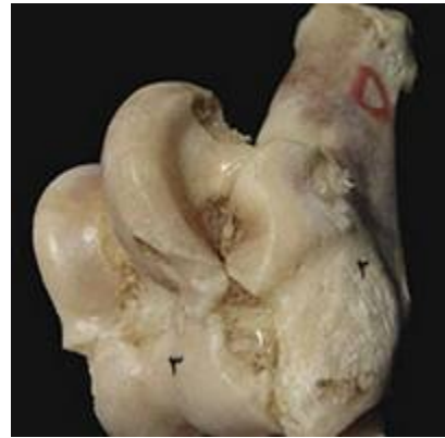
تصویر ۱۰: نمای سطح جانبی بخشی از مفصل مچ پای چپ گاو میش . ۱- رباط قاپی - پاشنه‌ای جانبی، ۲- استخوان پاشنه، ۳- قرقره‌ی پایینی استخوان قاپ