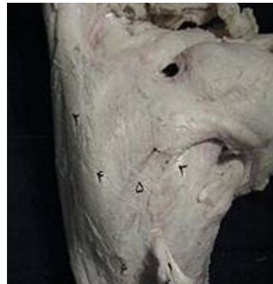
تصویر ۵: نمای سطح میانی مفصل میچ پای چپ گاومیش. ۱- وترهای درشت‌نی‌ای- قدامی و نازک نی‌ای- قلمی، ۲- بخش میانی رباط کف پایی بلند، ۳- رباط قاپی - مرکزی - پایین - قلم پایی، ۴- رباط کولترال داخلی بلند، ۵- رباط کولترال داخلی کوتاه، ۶- استخوان قلم پا