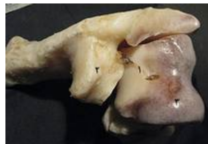
تصویر ۱۱: نمای سطح کف پائی بخشی از مفصل خم شده مچ پای راست گاو میش . ۱- رباط قاپی - پاشنه‌ای کف پائی، ۲- مسند قاپ استخوان پاشنه، ۳- قرقره پایینی استخوان قاپ