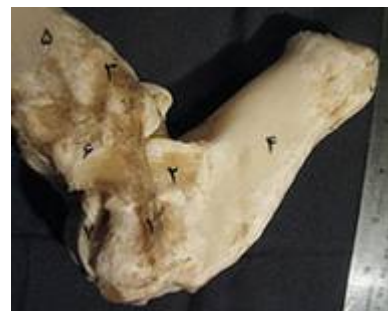
تصویر ۶: نمای سطح جانبی بخشی از مفصل خم شده میچ پای چپ گاومیش. ۱- بخش پاشنه‌ای-نازک‌نی‌ای، ۲- شاخه پاشنه‌ای-نازک‌نی‌ای، ۳- شاخه‌ی درشت‌نی‌ای - نازک‌نی‌ای، ۴- استخوان پاشنه، ۵- استخوان درشت نی، ۶- قوزک خارجی استخوان نازک نی