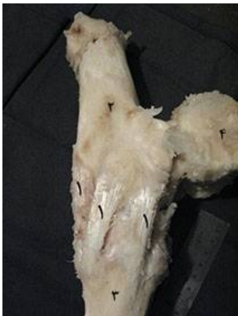
تصویر ۸: نمای سطح جانبی بخشی از مفصل میچ پای چپ گاومیش. ۱- رباط‌های پاشنه‌ای- قلم پائی، ۲- استخوان پاشنه، ۳- استخوان قلم پا، ۴- انتهایی پایینی استخوان درشت نی