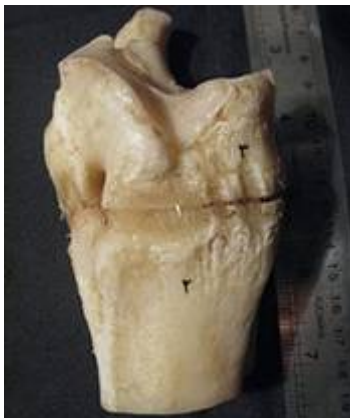
تصویر ۱۳: نمای سطح جانبی بخشی از مفصل مچ پای چپ گاو میش . ۱- رباط مچ پائی- قلم پائی، ۲- استخوان قلم، ۳- استخوان مرکزی- چهارگوش