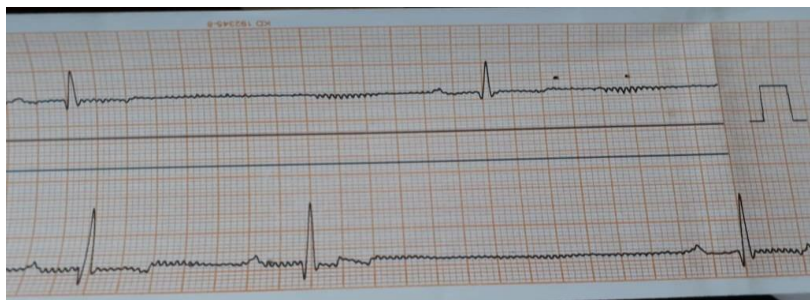
Figure 1: Sinus arrest and AV-block grade 1, in a dog after administration of medetomidine with acepromazine at 5 minute